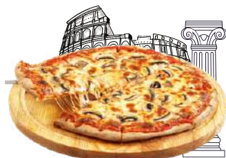
ROMANA VEGGIE vegetariano

pepperoni, longaniza praga, con 1 libra de nuestro queso mozzarella MiCarmita!